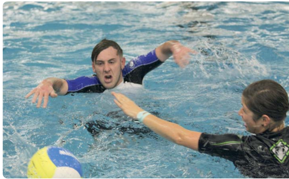
Für alle Teilnehmer war AQUABALL eine neue Praxiserfahrung. Spaß, Teamgeist und sich entwickelnder Ehrgeiz in spielerischer Form, das alles kann AQUABALL sein.

Das gemeinsame Erlebnis von Familien im kühlen Nass steht im Mittelpunkt dieses Projektes, mit dem sich Schwimmvereine als familienfreundliche Institutionen weiterentwickeln wollen. Dabei geht es um die Durchführung von Aktionstagen in öffentlichen Bädern, den sogenannten „DSV Family Treffs Schwimm-bad“, genauso wie um generationsübergreifende Vereinsangebote für die ganze Familie.