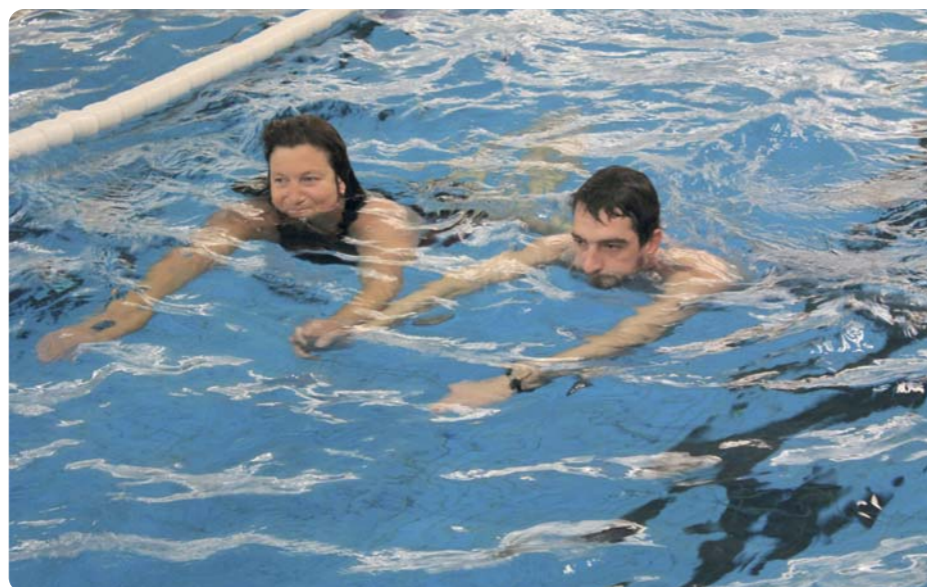
Synchronschwimmen mal anders – gehörte bei Wernigerode zum Praxisteil.

Zur DSV-Kick-Off-Veranstaltung in Mainz traten 4 Projektvereine zur Präsentation ihrer Konzeptionen für die DSV-Aktion „Family Treff Schwimm-bad“ an. Der Gastgeber Mainzer Schwimmverein 1901 e.V., der Harzer Schwimmverein Wernigerode 2002 e.V. aus Sachsen Anhalt, der Schwimmverein Schwäbisch Gmünd aus Württemberg und der Hamburger Schwimmverband sind die 4 Projektvereine des Deutschen Schwimm-Verbandes e.V. .