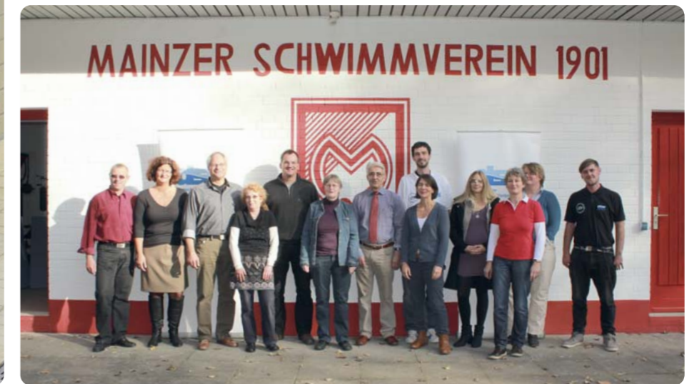
Kick Off mit den Vertretern der 4 Projektvereine in Mainz.