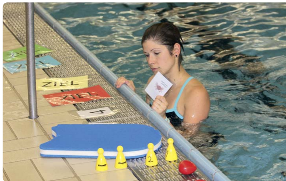
Stationenbetrieb mit unterschiedlichen koordinativen und kognitiven Aufgaben stellte der Schwimmverein Schwäbisch Gmünd vor.