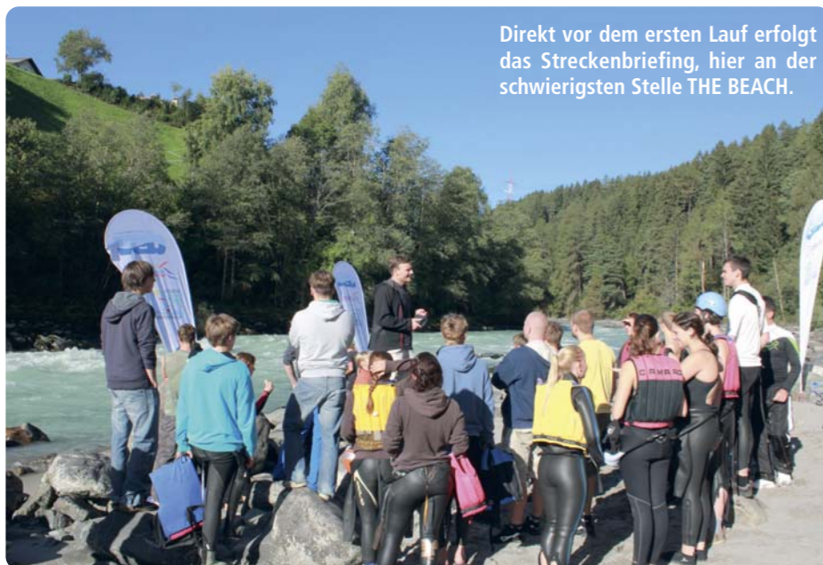
Direkt vor dem ersten Lauf erfolgt das Streckenbriefing, hier an der schwierigsten Stelle THE BEACH.

Exakt 54 Teilnehmerinnen und Teilnehmer stellten sich dann am Samstag, dem 11. September 2011 der Herausforderung Wildwasserschwimmen. Im Zielraum erfolgte früh morgens die Ausgabe der Ausrüstung: Neoprenanzug mit langen Armen, Schuhe, Helm, Brille und Rettungsweste gehören zum sicherheitsrelevanten Equipment für