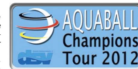
Mit 41 gemeldeten Mannschaften für die CHAMPIONS TOUR 2011/12 legt der DSV-