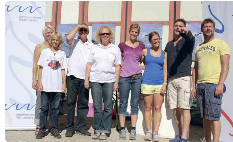
Das Orga-Team Roppen 2011 mit festem Blick nach vorne

den Ritt im Wildwasser. Jeder Starter erhielt einen Chip für die elektronische Zeitnahme. Zwischen der Kontaktschleife in der Startzone und dem Einlauf durch das Zieltor liegt eine Wasserstrecke von ca. 2000 m. Auf der Strecke müssen 3 Check-Points angeschwommen werden, der anspruchsvollste natürlich an der Sandbank THE BEACH. Die Sicherheit auf der gesamten Strecke wurde wie immer professionell durch die Streckenposten der österreichischen Wasserwacht gewährleistet.